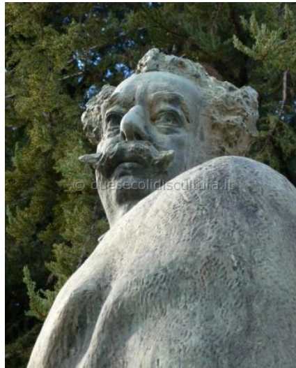
G. Giorgis. Monumento a De Amicis. Imperia. 1932.

Nonostante la diffidenza diffusa, in ogni caso, i mercati hanno premiato i titoli bancari dopo le anticipazioni sull'esito dello stress test da parte del Tesoro americano. Sfruttando la maggiore solidità psicologica dei mercati il Tesoro ha infatti preso coraggio e non ha dato la promozione politica a tutte le banche, imponendo anzi ricapitalizzazioni abbastanza significative a quasi tutte.